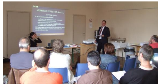
Formation sur le droit des asbl à Huy, 2007.